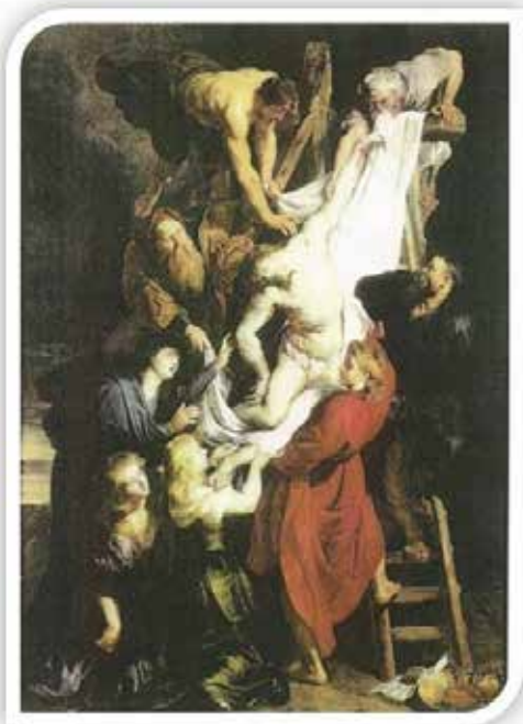
Slika Skidanje s križa Pétera Rubensa koju je Utemeljiteljica imala u sobi

“Ako u kući ne stanuje gospodar, brzo je zahvati tama, nečistoća i neizglednost, te se sve napuni smećem i smradom. Tako se i duša ako u njoj nema Gospodina s anđelima koji ga u njoj slave, ispunja tminama grijeha, ružnim privrženostima i svakovrsnom sramotom. Jao putu kojim nitko ne ide i na kojem glasa čovječjeg čuti nije. Stan je zvjeradi. Jao duši ako po njoj ne šeće Gospodin koji glasom svojim goni iz nje zle duhovne zvijeri” (sv. Makarije).