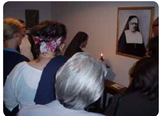
Mjesto preminuća Majke je sve više mjesto žarke molitve