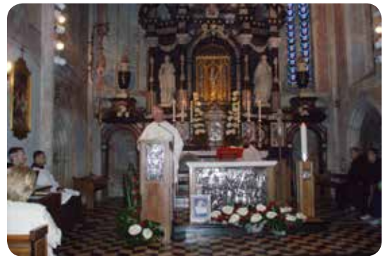
o. Anto Knežević, OCD, predvodi misno slavlje u svetištu