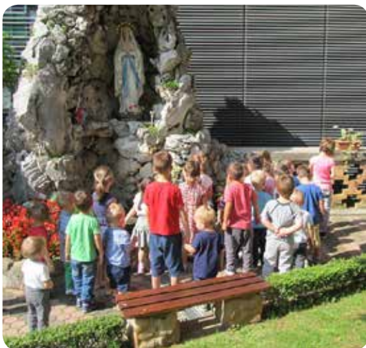
Djeca iz Dječjeg vrtića Mima

U povodu proslave Dana pobjede i domovinske zahvalnosti i Dana branitelja te godišnje proslave Gospe Lurdske, u vrtu samostana Presvetog Srca Isusova i Ženskoga učeničkog doma Marije Krucifikse Kozulić na Pomeriju u Rijeci, generalni vikar Šibenske biskupije Marinko Mlakić predvodio je u utorak 5. kolovoza svečano misno slavlje. Tom je prigodom obilježena 103. godišnjica otkad je u znak zahvalnosti za čudesno i potpuno ozdravljenje službenica Božja Marija Krucifiksa Kozulić dala izgraditi špilju Gospe Lurdske u vrtu samostana koja i danas tamo stoji.