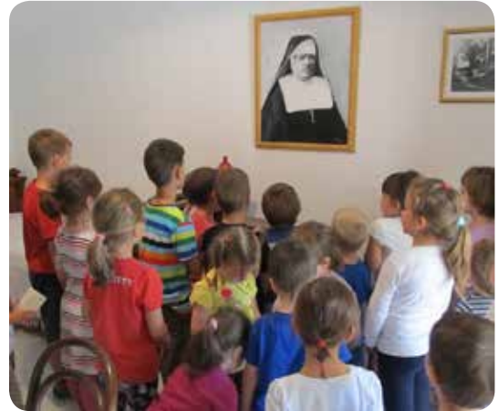
Djeca iz DV Mima mole zagovor Majke za svoje roditelje i tete u vrtiću

Djeci predstavi Majku koja je osobito ljubila siromašnu i ostavljenu djecu, koja ih je učila vjeri i vodila Isusu; obiteljima u ovoj - Godini obitelji - govori o vjeri i ljubavi koju je nosila u svome srcu, iskazivala je potrebnom bližnjemu i s vjerom strpljivo podnosila sve svoje teškoće. Mladeži govori o njezinim ide-