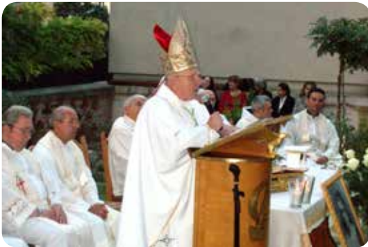
mons. Valter Župana, krčki biskup

Značajka je muževa i žena utemeljitelja raznih redovničkih zajednica da su na temelju svoga duhovnoga života dalekovidno i mudro uvidjeli prilike i prema tome potrebe vremena u kojem su živjeli te na temelju toga viđenja raspoznali svoj životni poziv. Mnogi, možda i većina od njih, nisu mislili na utemeljenje nekih zajednica, nego su jednostavno živjeli i radili.