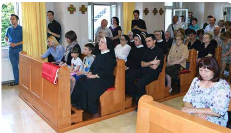
U kapeli Presvetog Srca Isusova u Pomeriju

u uskrsnuće. Marijina vjera okrunjena je vjedom u uskrsloga Krista. Ona se s ovoga svijeta preselila u sigurnu luku u noći 29. rujna 1922. Godine. Njezin nam lik još glasnije naviješta evanđelje, rječitije i snažnije nego kad je bila na zemlji. Marijin vapaj nama danas, posebice vama sestre koje živite pod njezinim imenom i Konstitucijama, isti je onaj gromoglasni kojega nam papa Franjo više kada govori o trgovini ljudima: “Želim da čujete vapaj Boga koji pita sve nas: ‘Gdje ti je brat?’ (Post 4, 9). ... To je nešto što se tiče svih nas! ... i mnogi imaju krv na svojim rukama zbog mirnog i nijemog sudioništva” (EG, 211). Uistinu je Papa glasan i prodoran, poput svetog Augustina koji kaže u svojim govorima “Gospodine probio si moju gluhoću”. Neka nam večeras službenica Božja Majka Marija Krucifiksa Kozulić progovori svojim žarom, onim istim kojim je sakupljala ostavljenu djecu, onim istim kojim se borila protiv struja i nedaća koje joj nisu išle u prilog. Taj žar je zasigurno moćan zapaliti i moje i tvoje srce ako mu dopustimo. Taj žar je žar Srca Isusova koje želi zapaliti cijeli svijet, ali po meni i po tebi, danas i ovdje. Amen.