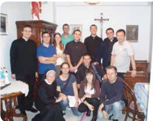
Bogoslovi i studenti Teologije u Rijeci