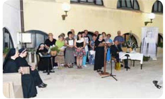
U atriju Kaštela u Crikvenici