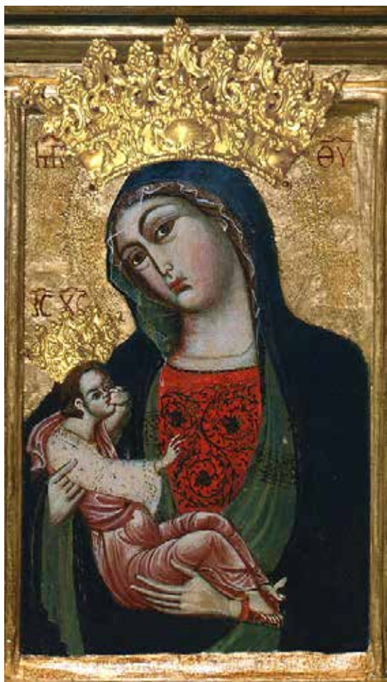
Majka Božja Trsatska

Neķa Źivi Djevica, ķoju svijet ķasti, naša Gospa od Presvetog Srca.