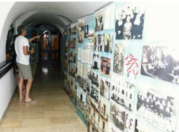
Detalj s izložbe